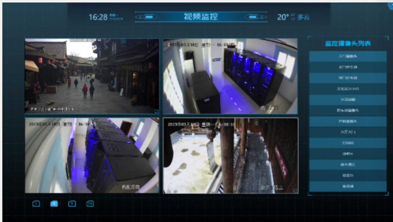
视频监控系统页面