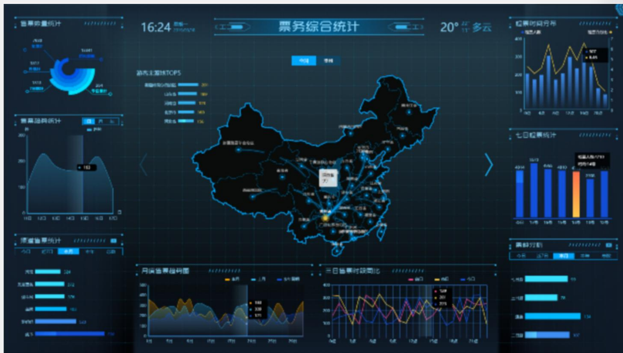
门禁票务系统页面