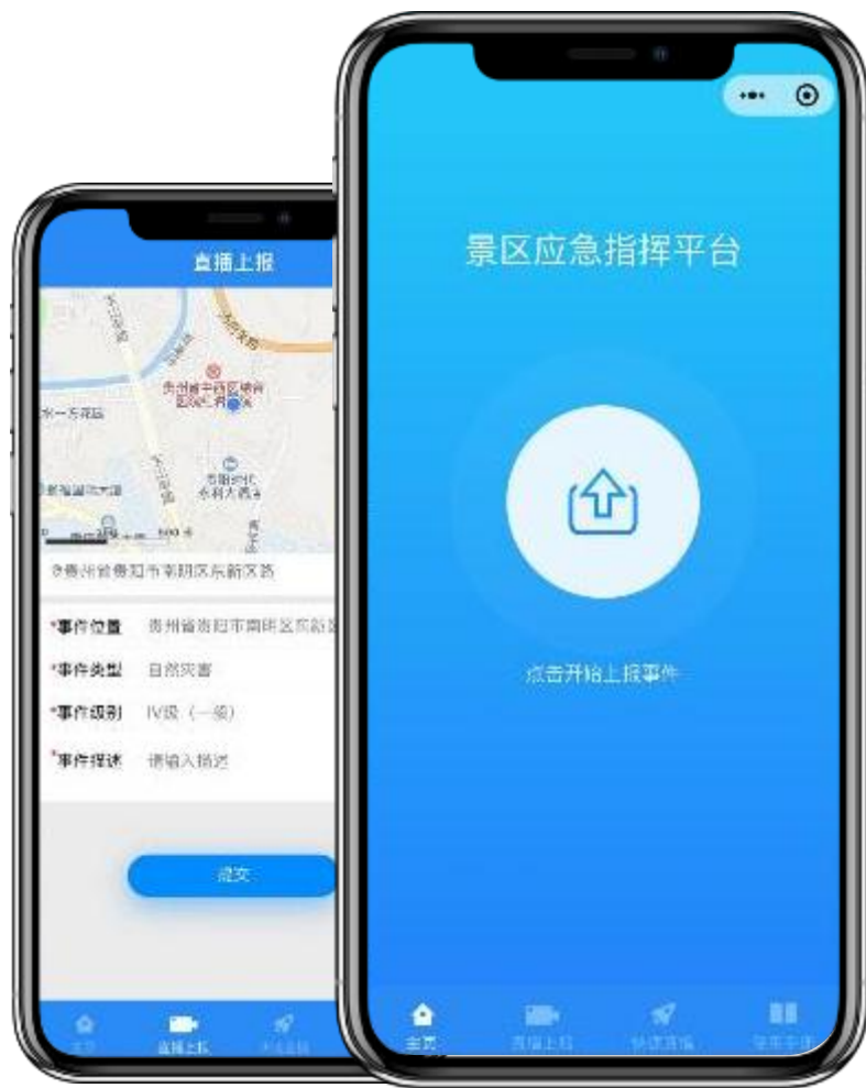
应急指挥小程序页面